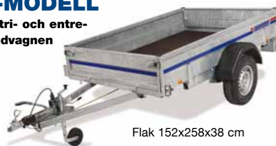
Flak 152x258x38 cm