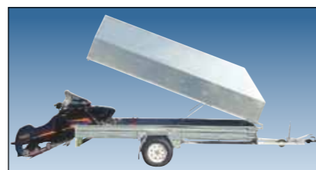
Ramper för fordonstransport finns som tillbehör.