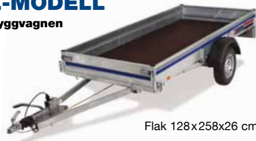
Flak 128x258x26 cm