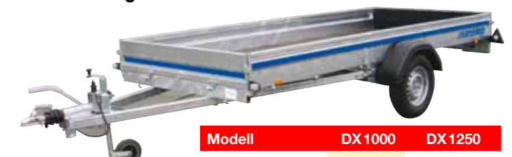
Flak 152x365x26 cm