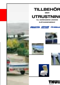
Fler praktiska tillbehör finns i vår tillbehörsbroschyr.