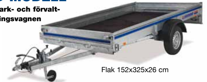
Flak 152x325x26 cm