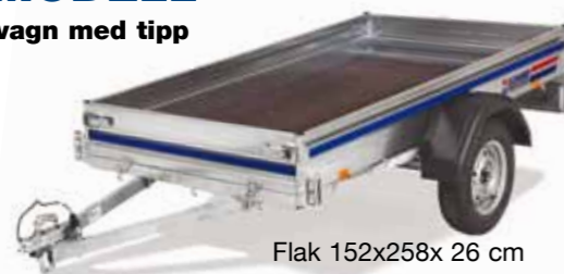
Flak 152x258x 26 cm