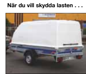
När du vill skydda lasten ... komplettera med glasfiberhuv