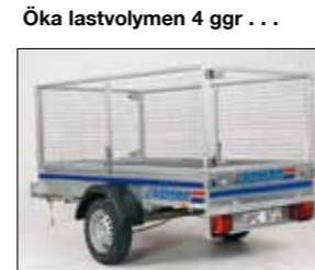
Öka lastvolymen 4 ggr ... komplettera med nätgrind